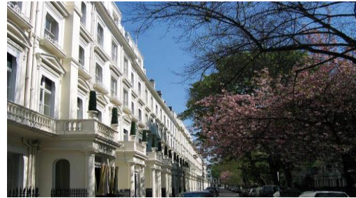
Hôtel The Caesar 26-33 Queen's Gardens, Hyde Park, London Tel. +44(0)20 7262 0022 - www.thecaesarhotel.com