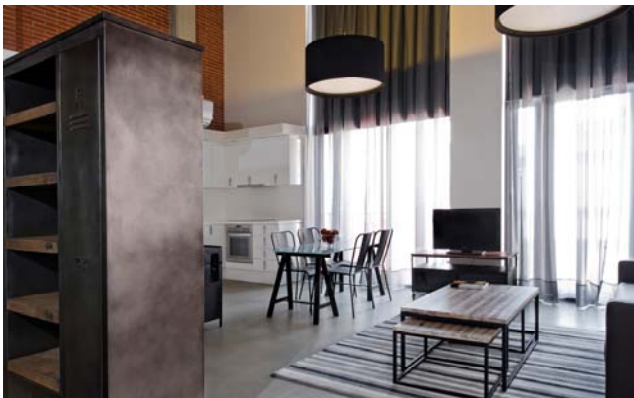
Apartamento La República

Dar a conocer la amplia oferta de Barcelona Apartment es el objetivo de Derby en la nueva edición de Fitur que se inaugura en Madrid la próxima semana, según el Director General de la cadena Joaquim Clos: "Derby ofrece este tipo de apartamentos turísticos de calidad desde 2004 cuando inauguró Allada Residence, una residencia de lujo para estudiantes, creciendo hasta contar con ocho edificios, dos de ellos incorporados en régimen de gestión a finales del 2013. Hemos sido pioneros en este negocio".