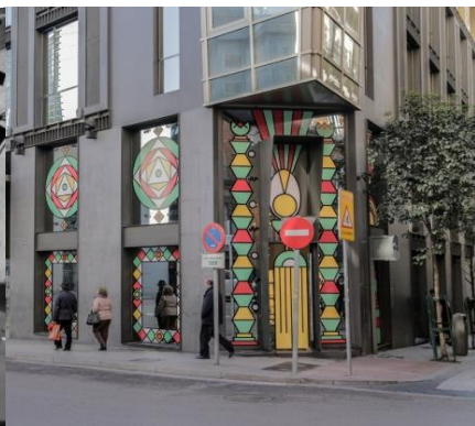
La fachada del Urban en 2015