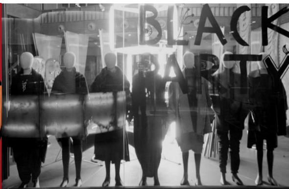
En 2010 se celebró la primera edición de Glass Art