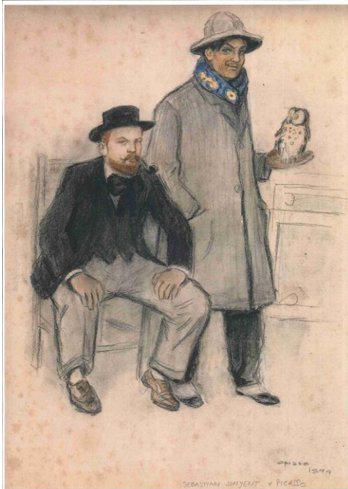
“Picasso y su amigo y protector, el pintor Sebastià Junyent”. Obra de Ricardo Opisso

Jordi Clos, presidente de Derby Hotels Collection, amplía el primer museo Opisso con dos ilustraciones del dibujante catalán adquiridas recientemente