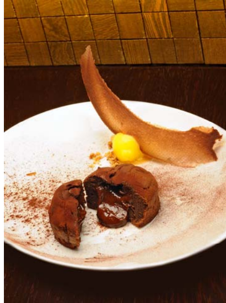
Tentación de Chocolate con sorbete de mandarina

Aunque la carta de El Regulador invite a ello, no es aconsejable compartir platos en una primera cita, para evitar conflictos o negociaciones... quizá sea más adecuado compartir el postre. En este sentido, para una primera cita no falla nunca el chocolate. La Tentación de Chocolate con sorbete de mandarina o los Buñuelos con sorbete de pimienta de Sechuan son dos de las delicias que nos propone el restaurante del Bagués. El chocolate líquido y caliente, los contrastes de sabores y texturas los convierte en un broche final de excepción para una cena romántica.