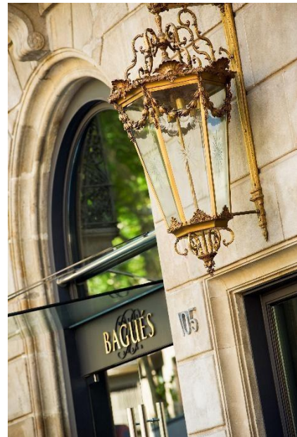
Fachada, Hotel Bagués 5*