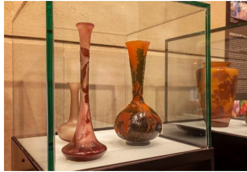
Jarrones de pasta de vidrio de la colección "Joyas del Art Nouveau"

La diversidad y complejidad de la técnica empleada en estas piezas es asombrosa: desde el meticuloso grabado al ácido hasta el repujado en estaño, pasando por la delicada técnica de la "marquetería", donde los artistas aplicaban elementos decorativos de vidrio sobre la pieza aún caliente. Cada obra es un testimonio del dominio artístico y la innovación técnica de su creador, reflejando una habilidad y un cuidado meticuloso en su elaboración.