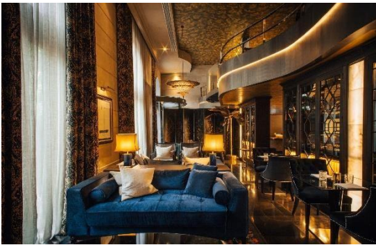
Lobby, Hotel Bagués 5*

El Hotel Bagués 5* destaca por ser uno de los edificios de la corriente modernista más característicos de Barcelona. Con solo 30 habitaciones meticulosamente diseñadas, rinde homenaje al legado de Bagués-Masriera, fusionando la sofisticación con la majestuosidad del palacio que lo cobija. Bajo la dirección personal de Jordi Clos, este proyecto trasciende la noción convencional del hotel, encarnando la esencia misma de Derby Hotels Collection.