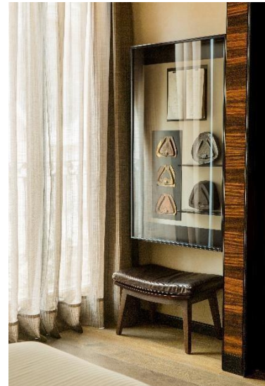
Habitación superior, Hotel Bagués 5*