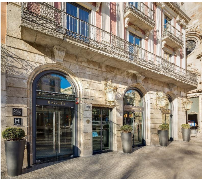
Fachada, Hotel Bagués 5*

Lo que refiere a la arquitectura, los edificios reflejan la esencia de la naturaleza, con fachadas decoradas con motivos florales, balcones sinuosos y detalles intrincados de formas extravagantes y asimétricas, tal como refleja el edificio del Hotel Bagués 5*, catalogado como monumento histórico de la ciudad.