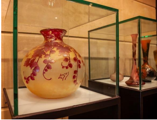
Jarrón de vidrio tallado y grabado al ácido de la colección "Joyas del Art Nouveau"