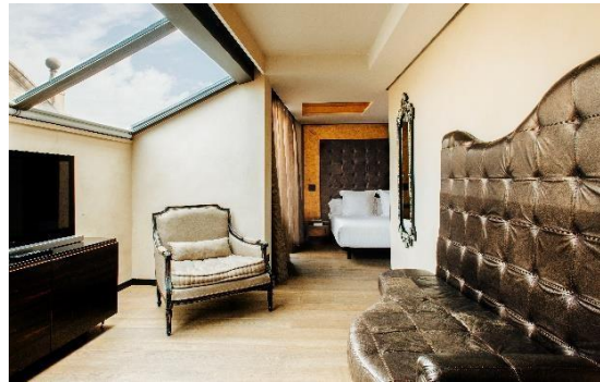
Jewel Suite, Hotel Bagués 5*