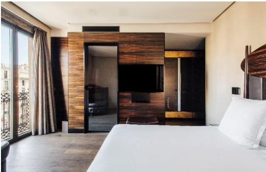
Habitación Deluxe, Hotel Bagués 5*

La influencia del arquitecto y diseñador Mackintosh, está presente en cada una de ellas, tanto en su mobiliario y decoración, como en algunos de los símbolos del arquitecto que se "esconden" en cada rincón, un guiño reservado para aquellos que aprecien su valor. Cada habitación y suite es única y se ha decorado con los mejores materiales, como madera de ébano de Madagascar, pizarra de la India, pan de oro o mármol importado de Brasil.