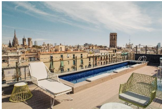
Terraza, Hotel Bagués 5*

La terraza del Hotel Bagués 5* se erige como un espacio emblemático de la ciudad de Barcelona. Permite una visión panorámica de 360° sobre el Barrio Gótico, que abarca desde la magnífica Iglesia de Belén hasta la imponente Catedral y Las Ramblas. Además, cuenta con una piscina que se asoma sobre la ciudad. Este espacio ha sido diseñado y amueblado para ser disfrutado. Ofreciendo un equilibrio entre pasado y futuro a través de su diseño innovador y sus vistas impresionantes.