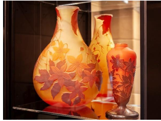
Jarrones de vidrio tallado y grabado al ácido de la colección "Joyas del Art Nouveau"