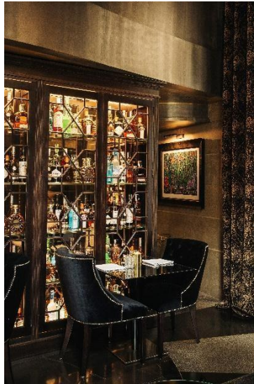
Restaurante, Hotel Bagués 5*