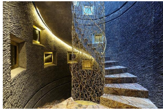
Escalera principal, Hotel Bagués 5*