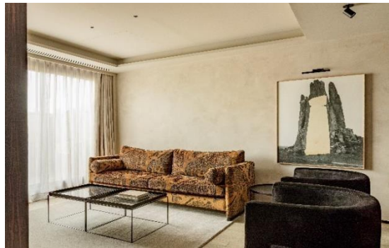
Suite Diamond, Hotel Bagués 5*