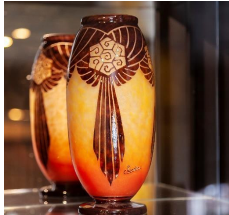
Jarrón de vidrio de la colección "Joyas del Art Nouveau"

Su habilidad para emplear vidrio de color era excepcional e innovadora. Trabajaba con una amplia gama de óxidos metálicos para lograr tonos sutiles y profundos, desde el suave "Clair de lune", hasta colores vivos y llamativos para aportar a la obra profundidad y riqueza de color. También jugó con metales inusuales en aquella época, como el talio y el iridio, estos le permitieron producir sombras oscuras.