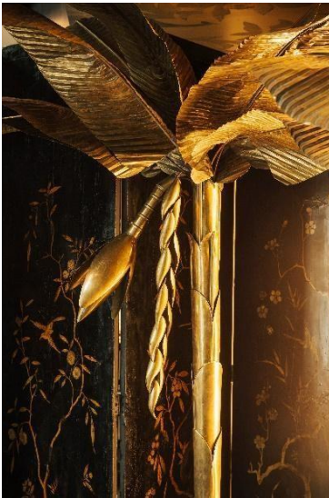
Arte, Hotel Bagués 5*

Tanto el diseño como la decoración que constituyen el Hotel Bagués 5*, son una reinterpretación de la corriente Art Nouveau en su tendencia inglesa y escocesa, catalogada como "Liberty". Así mismo, encontramos una clara inspiración en el estilo del arquitecto y diseñador Charles Rennie Mackintosh.