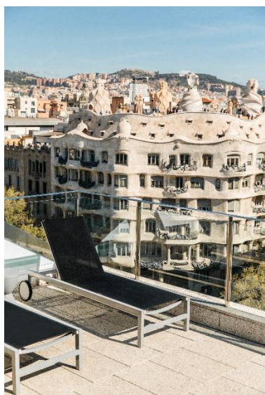
Terraza del Pedrera Penthouse de los apartamentos Suites Avenue

El Claris Hotel & Spa y los dos Pedrera Penthouse del Suites Avenue acondicionan sus espacios al aire libre para reuniones a medida