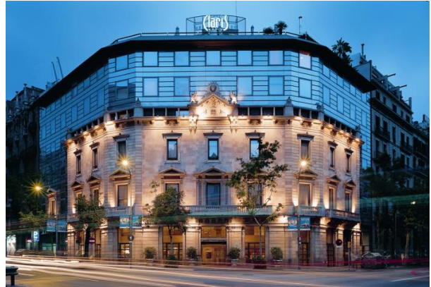
Claris Hotel & Spa

Dos de los principales hoteles de Derby Hotels Collection acercan posiciones estas Navidades. El Claris Hotel & Spa en Barcelona y el Hotel Banke en Paris proponen estancias singulares en dos de las capitales europeas con más magia durante las fiestas navideñas.