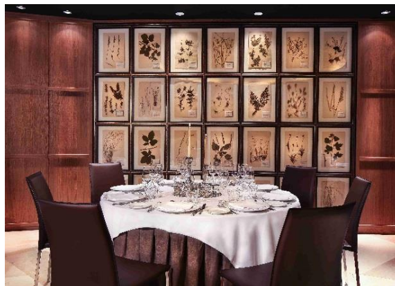
Salones Garden y Vedruna del Claris Hotel & Spa de Barcelona

En Navidad, viajar a París siempre es una buena opción. Para todos aquellos que tengan pensado pasar las fiestas en la capital francesa, el Hotel Banke del grupo Derby Hotels Collection ofrecerá un menú para Nochebuena y otro para Fin de Año.