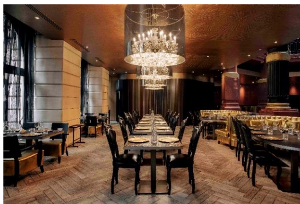
Restaurante Josefín del hotel Banke de París