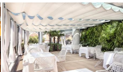
La Terraza del Claris